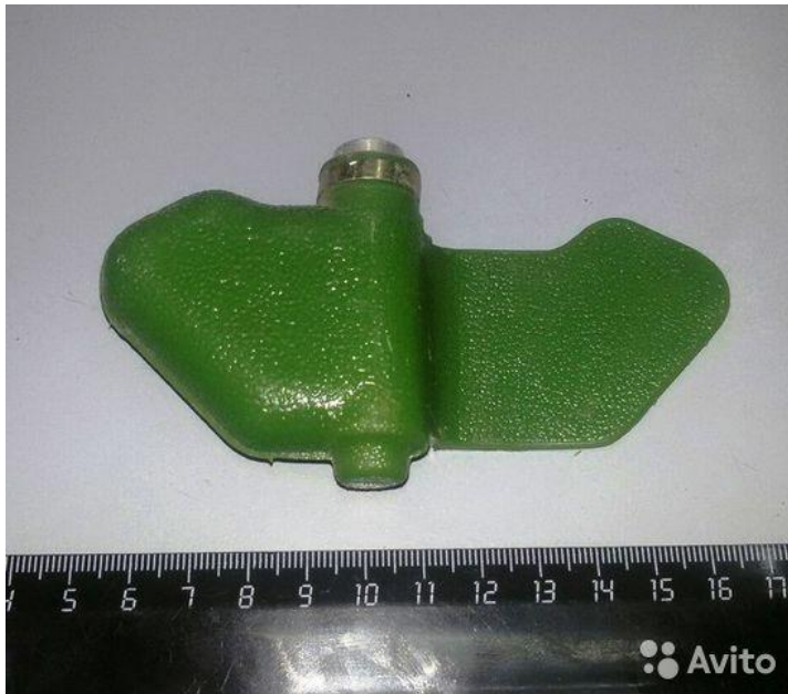
«Мина – ЛЕПЕСТОК» в боевом положении на земле (присыпана грунтом):